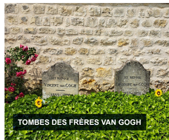
TOMBES DES FRÈRES VAN GOGH