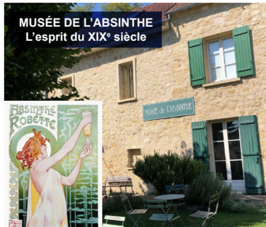
MUSÉE DE L'ABSINTHE L'esprit du XIX e siècle