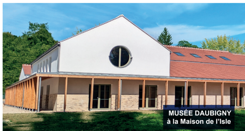
MUSÉE DAUBIGNY à la Maison de l'Isle

OUVERTS DU MARDI AU DIMANCHE / OPEN ALL YEAR ROUND FROM TUESDAY TO SUNDAY