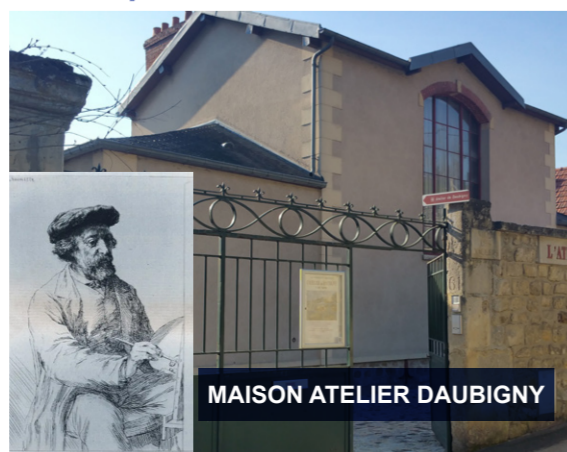
MAISON ATELIER DAUBIGNY