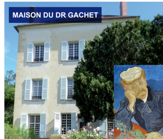
MAISON DU DR GACHET