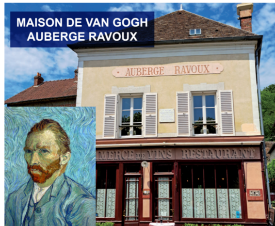
MAISON DE VAN GOGH AUBERGE RAVOUX

OUVERTS DU MERCREDI AU DIMANCHE / OPEN FROM WEDNESDAY TO SUNDAY